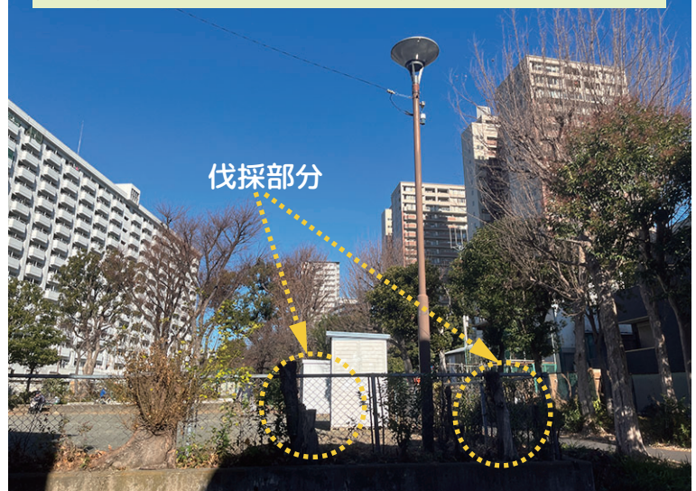
街路灯を覆い隠していた老木を伐採（幸町3丁目1-4付近）