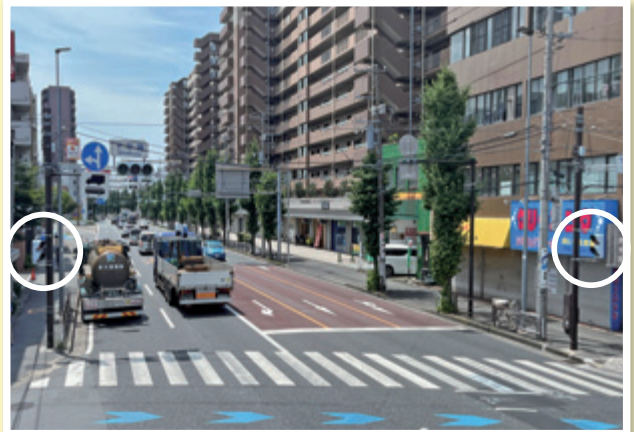
横断歩道の青信号を3秒延長 (高齢者が渡り切れない府中街道「下平間」交差点)