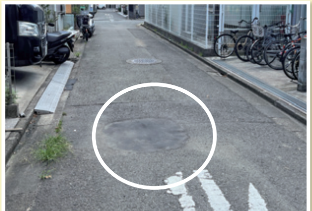
保育園隣接道路の補修 (古市場2丁目キディ古市場保育園裏の道路の凹みを補修)