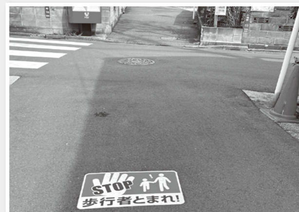
飛び出し注意喚起 シール貼付 (戸手2-4-11付近の交差点の路面に貼付)