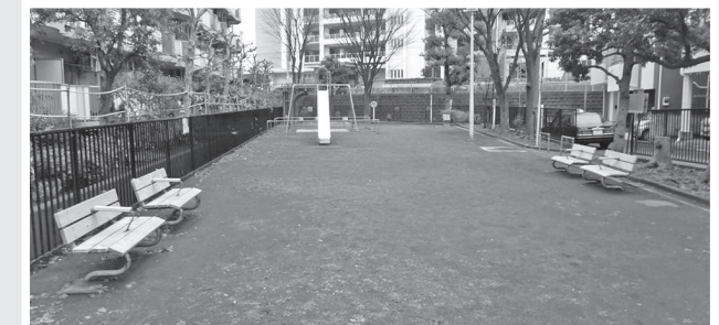
戸手4丁目 戸手多摩川公園のベンチを補修 老朽化しトゲが出ていたので新品に交換。