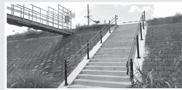
多摩川堤防に手摺り設置 堤防から河川敷への階段が老朽化し、手摺りもないことから、階段の補修と手摺り設置をしました。(古市場排水樋管横：古市場ポンプ場から河川敷に降りる付近)