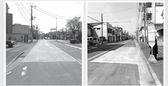
歪んだ道路を補修

5cm程度盛り上がった箇所があり、バイク・自転車等が転倒する危険があったので補修。(古市場交番前バス停付近と古市場交番付近)