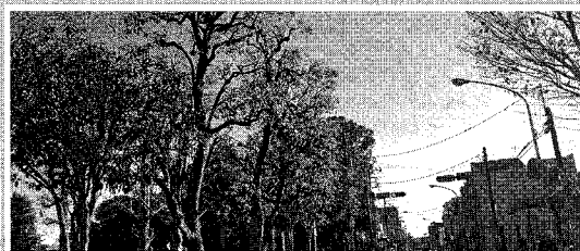
信号の安全性向上